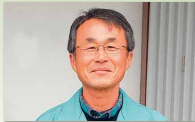
講師：株式会社 渡辺採種場 様