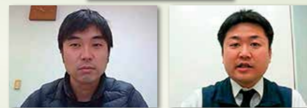
講師：株式会社 サカタのタネ 様