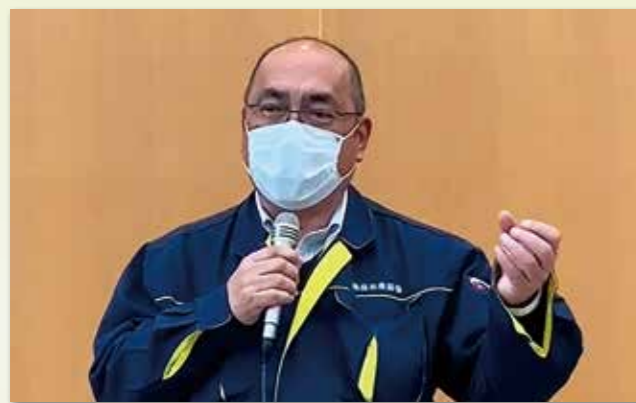
講師：株式会社 高井南茄園 様